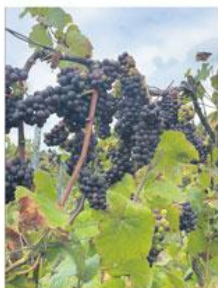
31.7 EN BOBLLENDE AFTEN PÅ HUSER GÅRD