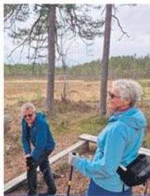
1.8 TUR TIL BYGDEBORGEN

Fenstad Vel inviterer til en boblende aften på Huser Gård. Bli med på en stemningsfull og smakfull kveld hvor musserende vin står i sentrum. Sted: Huser Gård, Huservegen 128 2170 Fenstad Tid: kl. 18:00-20:00 (begrenset antall) Pris: 300,- Bindende påmelding innen 24/7 til ninni@akershus.com