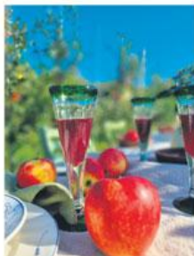
30.7 OST, MOST OG SIDER

I regi av Nes kirke og Raumes historie- lag blir det Pilegrimsvandringen til Nes kirkeruin. Oppmøte kl 17:00 ved Nes kirke, 18:00 Olsok gudstjeneste 19:00 Kveldsväl i kjerkestua