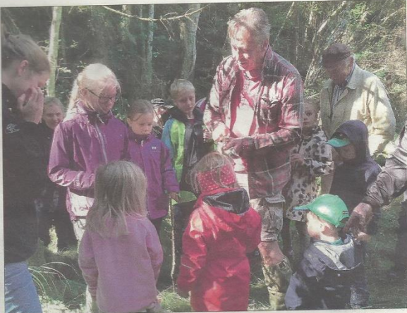
FLOTT DAG I TROLLSKOGEN: Små og store koste seg i trollskogen ved Huser gård søndag da Kulturminnebøndene avsluttet årets sesong.