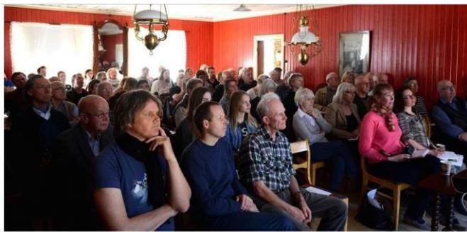
BILDETEKST: Populært seminar: Pågangen til seminaret på Veset torsdag var så stor at arrangøren måtte si nei til noen. Stua var fylt til randen.

Kulturminnebønderne fikk i vår tilsagn om 75.000 kroner i tilskuddsmidler til infotiltak, søkte delutbetaling 19.5.2015 og fikk i juni utbetalt 54.000 kroner. Vi oversender nå sluttrapport og ber om å få utbetalt de resterende 21.000 kronene.