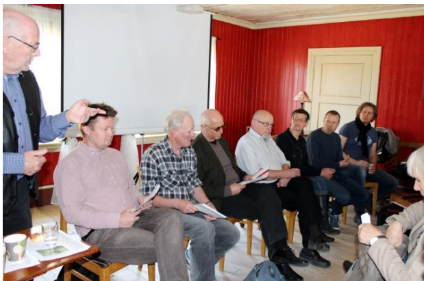
Mye fagkunnskap samlet på «podiet». Fra paneldebatten